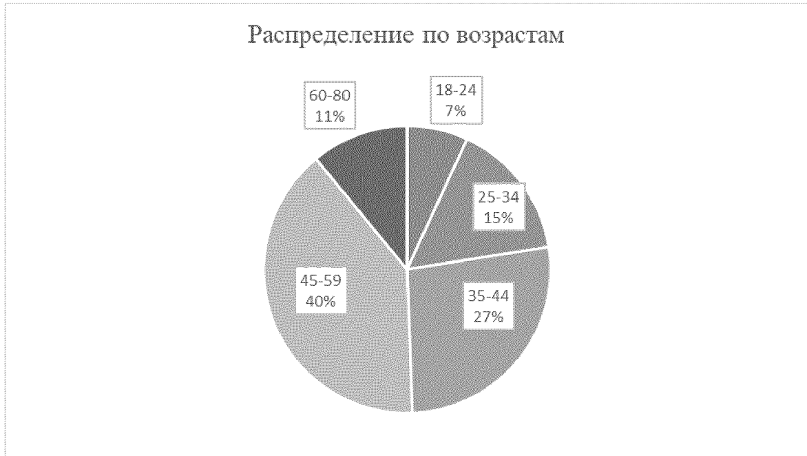
Рис. 2 – Возрастной состав участников тестирования

Максимальное количество прошедших тестирование пришлось на возраст от 45 до 59 лет (4573 человека или 39,6 %). И у этого возраста самый высокий показатель по общему индексу финансовой грамотности – 16,41 балла, в том числе по индексу «Знания» (7,26) и индексу «Навыки» (5,64). По индексу «Установки» люди в возрасте от 45 до 59 лет набрали 3,51 балла выше чем у молодежи 3,28